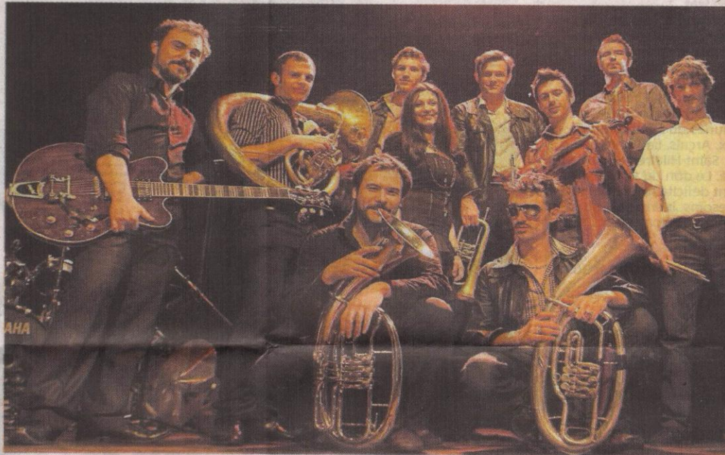
Le groupe Ziveli Orkestar de Paris sera la tête d'affiche du 10 e anniversaire de l'association Explor'Art.

Depuis 2001, une trentaine d'événements a été organisée à Aiffres, Niort, La Crèche et Parthenay, et les membres d'Explor'Art s'attachent à travailler essentiellement avec des groupes locaux.