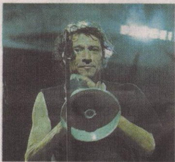
Le groupe de rock cuivré, Bolchoï Karma Expérience, de Parthenay.

Les festivités débiteront vendredi 28 octobre, à 20 h 30, avec au programme la compagnie Zo Prod, qui proposera un théâtre d'objets intitulé « Il y a quelque chose de pourri », variation hamletique de et par Pierre Porcheron.